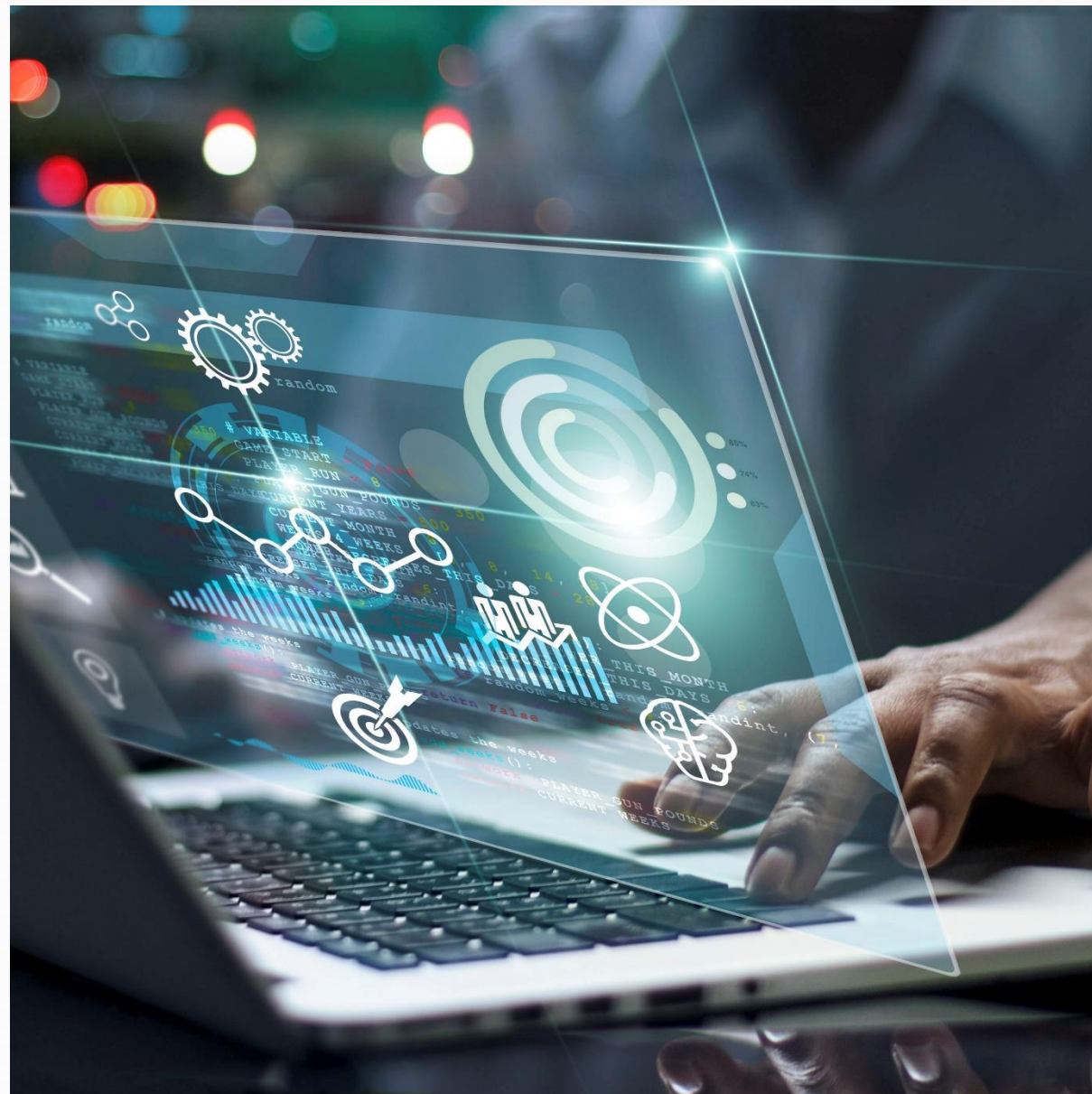
Via AI competenties in kaart brengen